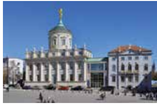
Potsdam Museum – Forum für Kunst und Geschichte