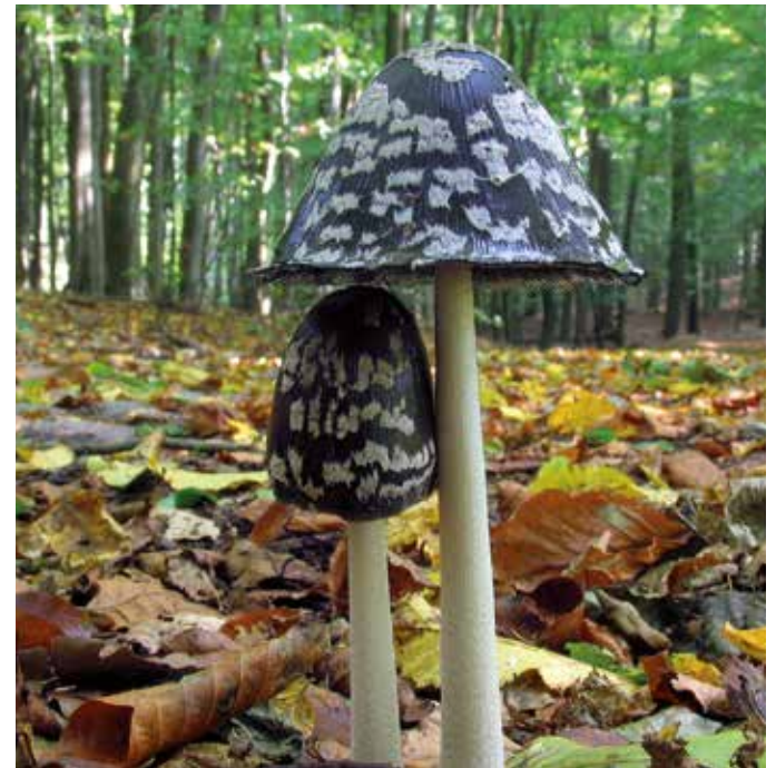
Specht-Tintlinge ( Coprinus picaceus )