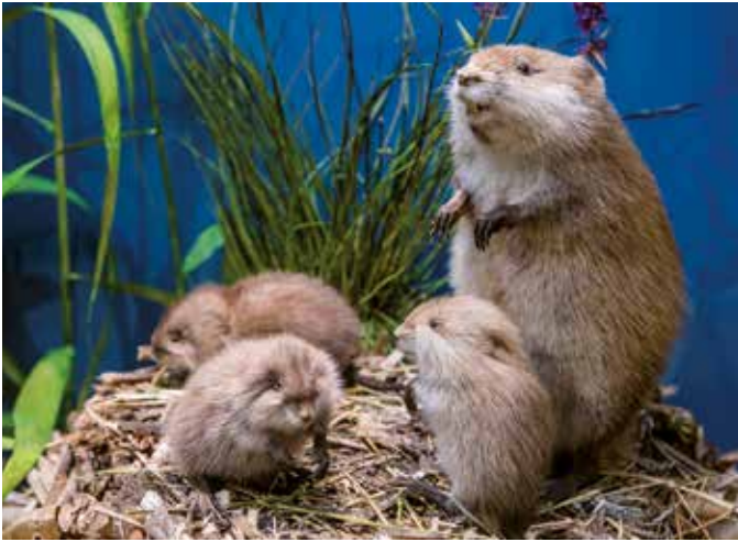
Präparate einer Bisam-Familie ( Ondatra zibethicus )