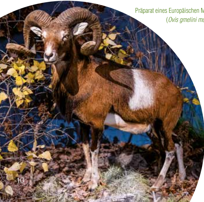
Präparat eines Europäischen Mufflons ( Ovis gmelini musimon )

Einfach mal die Seele baumeln lassen und in eine märchenhafte Tierwelt eintauchen. Das Naturkundemuseum Potsdam begrüßt Kinder und ihre Begleitung zu tierischen Abenteuern aus der Fantasiewelt verschiedener Künstlerinnen und Künstler.