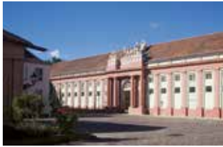
Haus der Brandenburgisch-Preußischen Geschichte