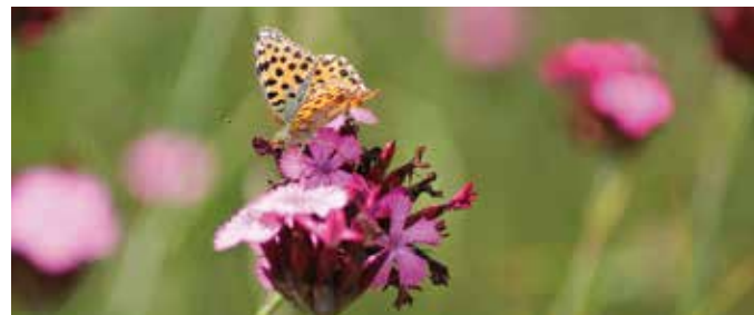
Karthäusernelke ( Dianthus carthusianorum )