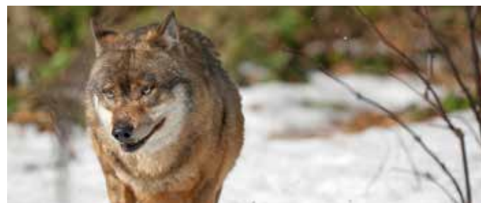
Europäischer Grauwolf ( Canis lupus lupus )