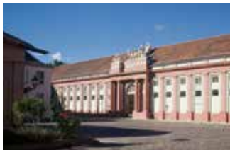
Haus der Brandenburgisch-Preussischen Geschichte