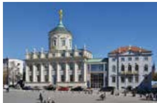
Potsdam Museum – Forum für Kunst und Geschichte