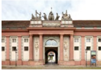
Brandenburg Museum für Zukunft, Gegenwart und Geschichte