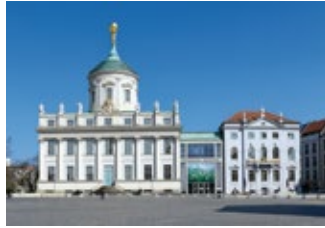
Potsdam Museum Forum für Kunst und Geschichte